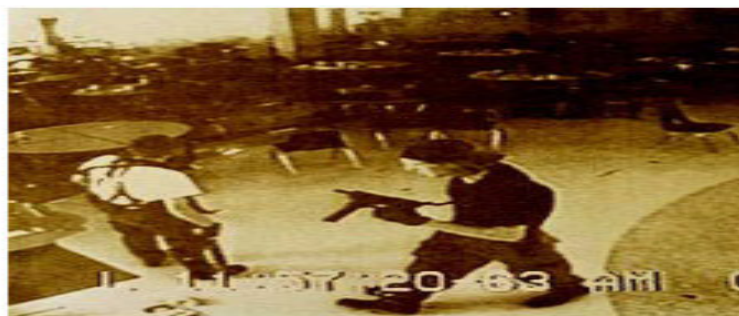
Columbine shooting August 20, 1999